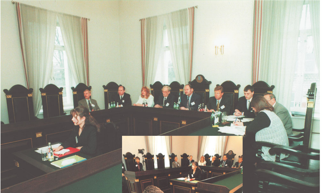
28. märtsil 1998 toimus Riigikohtus Eesti esimene harjutuskohtu võistlus.